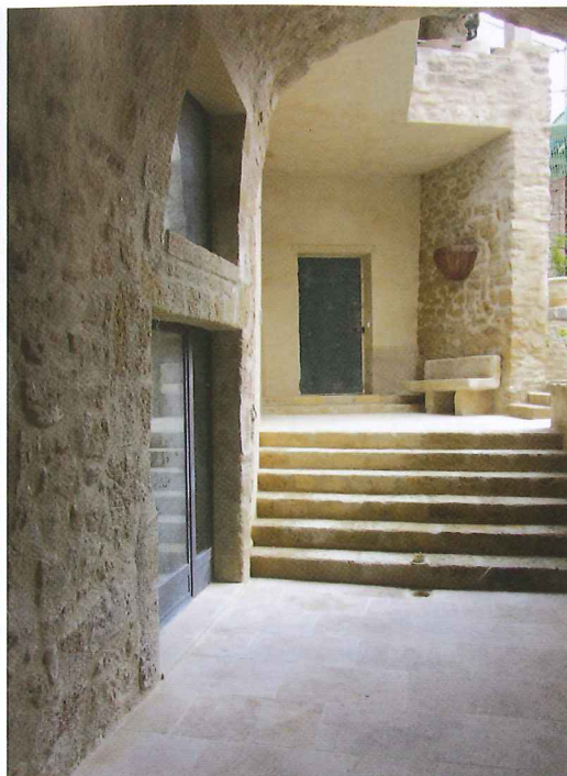
En plein village, le patio est apaisant. Le métal et le verre se marient discrètement avec la pierre.